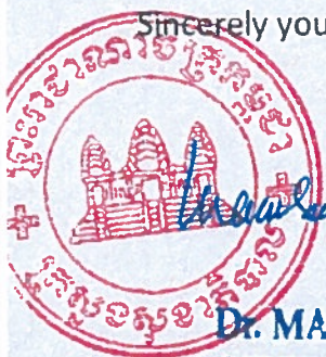
Dr. MAM BUNHENG MINISTER OF HEALTH